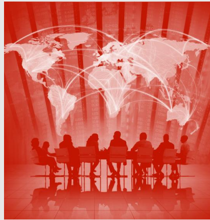
數位貿易國際規範的發展